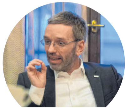
Kickl im VN-Interview über Asyl, Assange und Waffenverbotszonen.

stattfinden, nimmt der Minister zur Kenntnis. Er kann aber nicht verstehen, was am Asylrecht unmensch-